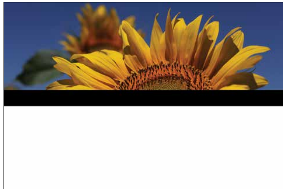
מאיה סמירה, "שיבושים", 2013