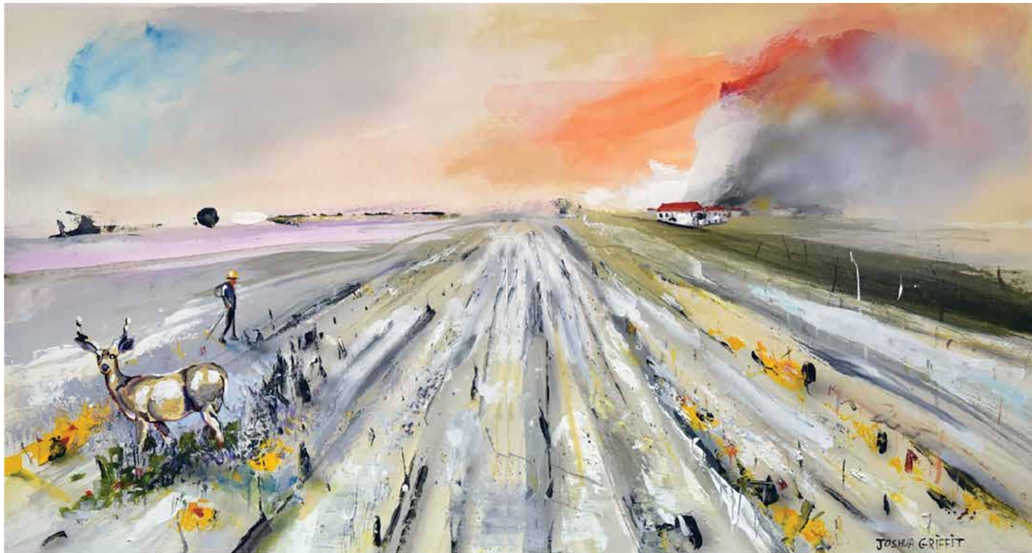
Joshua Griffit, Kibbutz in the South , 2019 Acrylic on paper

יהושע גריפית, "קִיבוּץ בדרום", 2019 אקריליק על נייר