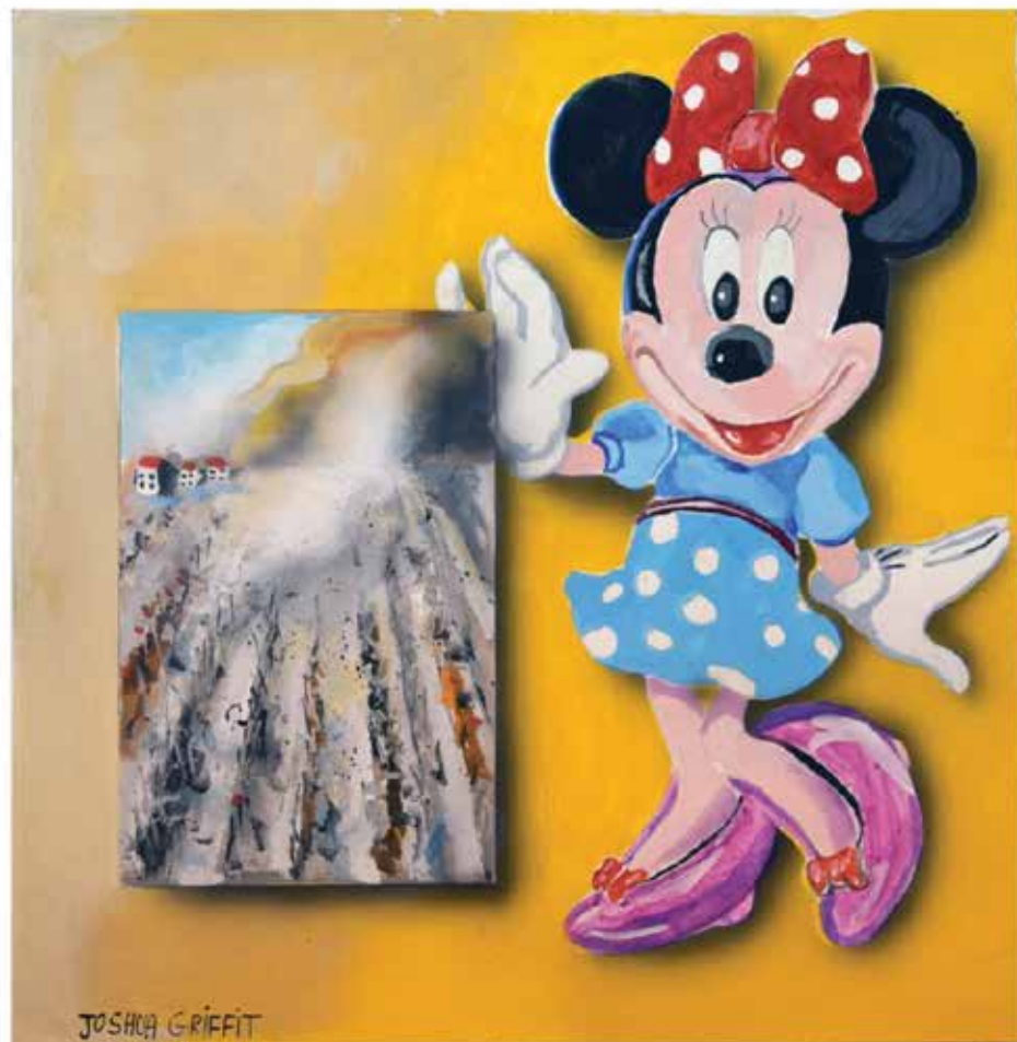
Joshua Griffit, See the Field Burn , 2019 Acrylic on paper