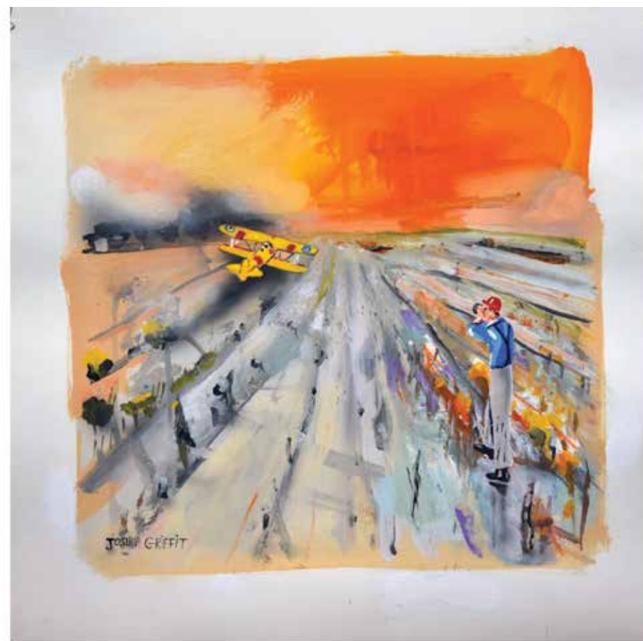
Joshua Griffit, Orange Sky , 2019 Acrylic on paper