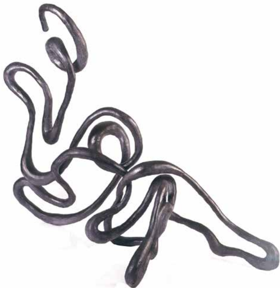
Yochi Shrem | Following the Line Three sculptures from a series

יוכי שרם | "מעקב אחר הקו" שלושה פסלים מתוך סדרה