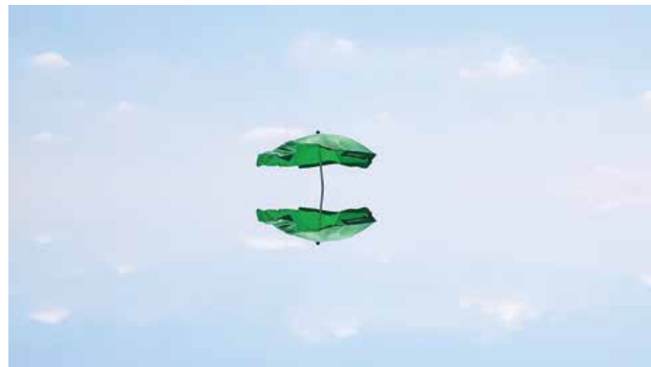
מאיה סמירה, "השתקפויות", 2018