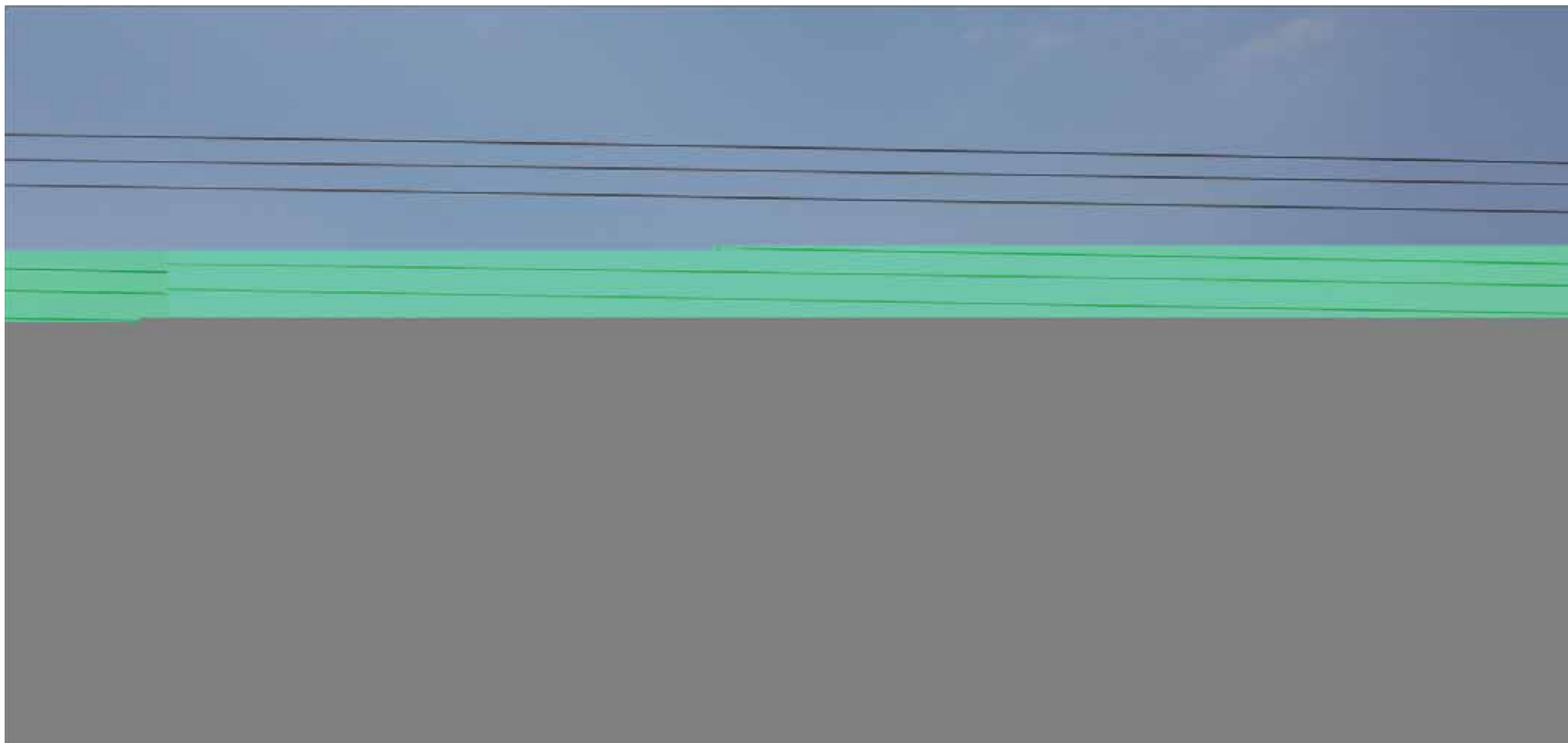
Maya Smira, Errors , 2013