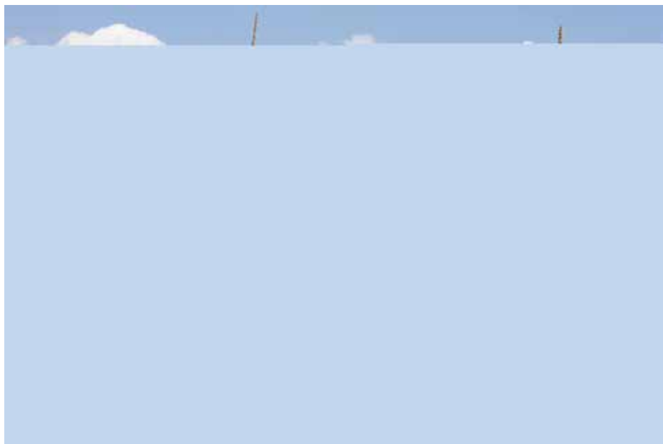
Maya Smira, Errors , 2013