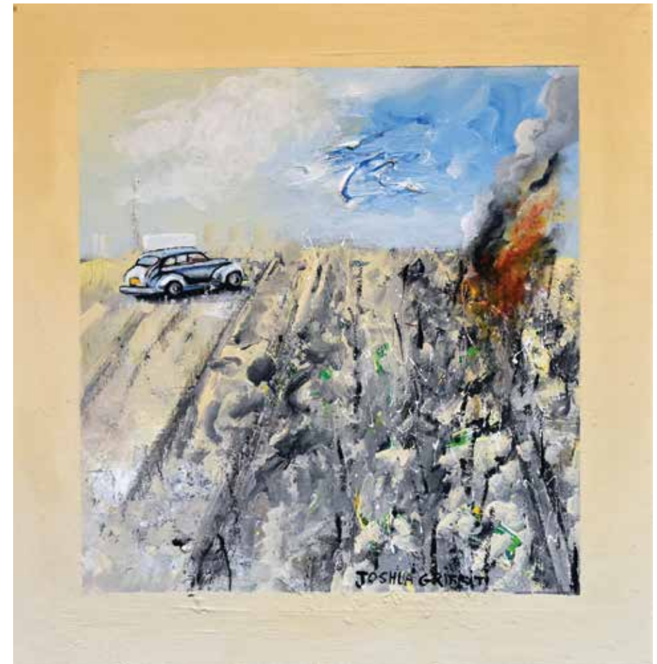
Joshua Griffit, Field in the South , 2019 יהושע גריפית, "שדה בדרום", 2019 Acrylic on plywood אקריליק על דיקט