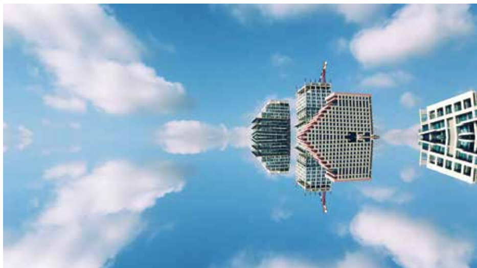
Maya Smira, Reflections , 2018